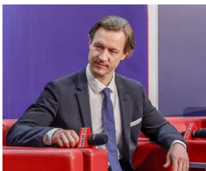
Gernot Blümel, Bundesminister für Finanzen, ging auf Details der ökosozialen Steuerreform ein